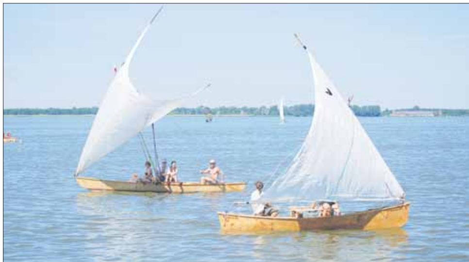
Goście zlotu będą mogli porozmawiać z budowniczymi łodzi oraz w miarę możliwości technicznych i czasu przepłynąć się jedną z nich.

Ubiegłoroczne spotkanie spotkało się z dużym zainteresowaniem zarówno wśród armatorów tych nietypowych w naszej części świata jednostek, koszalińskich żeglarzy i dużej grupy widzów, która obejrzała paradę jachtów na wodzie. Na Jamnie zagościło pięć spośród dziewięciu pływających w Polsce polinezyjskich łodzi.